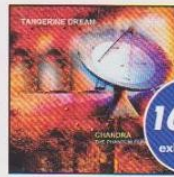
TANGERINE DREAM Chandra The Phantom Ferry Part II New Album