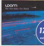
LOOM Tree Hates The Forest J.Froese J.Schmoelling/Waters