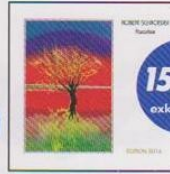
ROBERT SCHROEDER Paradise Edition 2014 The original from 1983 with bonus